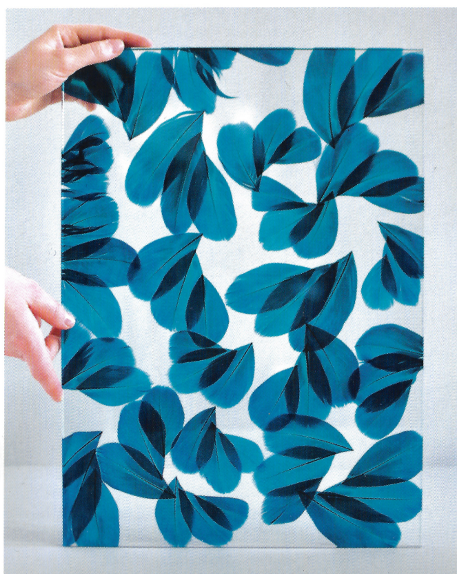
CI-DESSUS : ECHANTILLONS DE VERRRE FEUILLETÉ ET PLUMÈSE