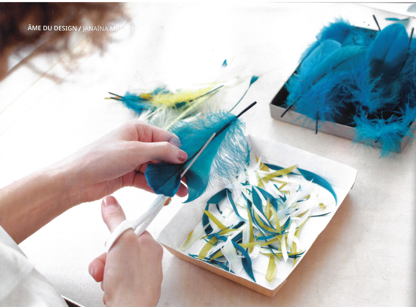
LES PLUMES D'OIE SONT DÉCOUPÉES AVANT D'ÊTRE INCRUSTÉES ENTRE DEUX PLAQUES DE VERRRE.