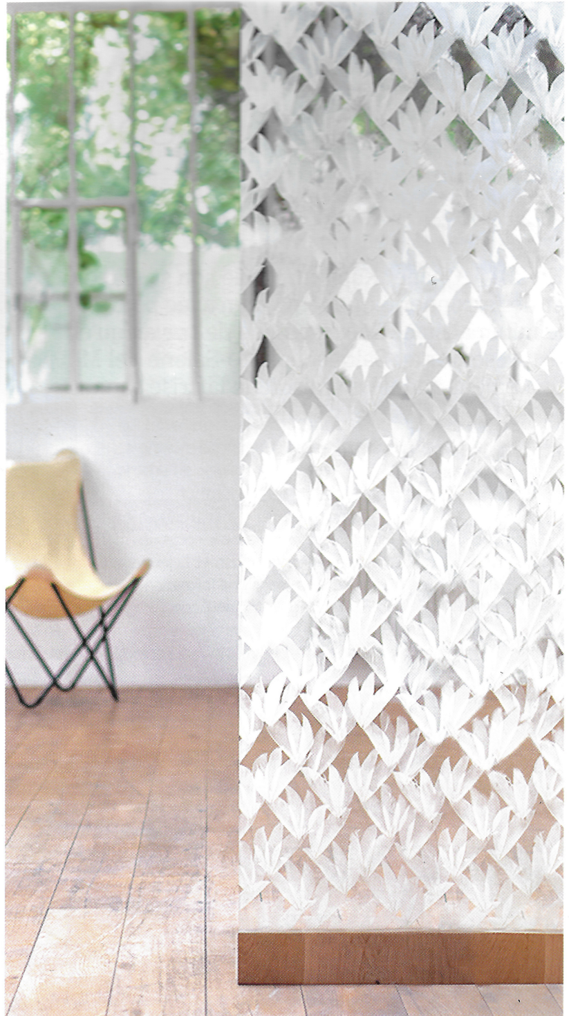
PAROI DE VERRE FEUILLETÉ INCRUSTÉE DE PLUMES D'OIE BLANCHES. © Janaína Milheiro

Et dans cette période où l'on repense à travailler les éléments de séparation, l'aménagement avec des panneaux protecteurs sans être occultants, son travail retentit différemment en apportant à la contrainte la légèreté, la poésie, la douceur intemporelle qu'ils insufflent à l'espace. On imagine très bien leur adaptation dans des projets d'aménagement de luxe (hôtels, résidences, bureaux...) ou pour le moins haut de gamme.