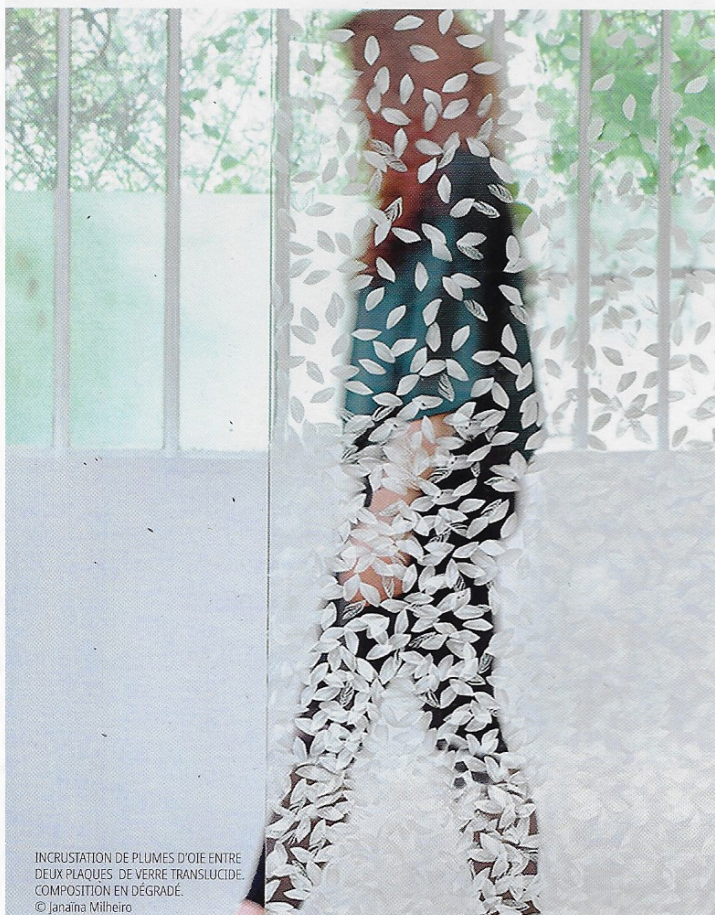
INCRUSTATION DE PLUMES D'OIE ENTRE DEUX PLAQUES DE VERRE TRANSLUCIDE. COMPOSITION EN DÉGRADÉ.