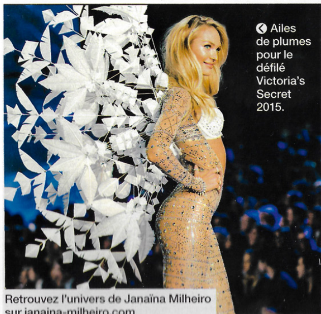
◀ Ailes de plumes pour le défilé Victoria's Secret 2015.