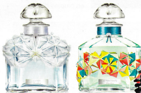
✔ Les parures des flacons « Les Quatre Saisons » de Guerlain.

Retrouvez l'univers de Janaina Milheiro sur janaina-milheiro.com